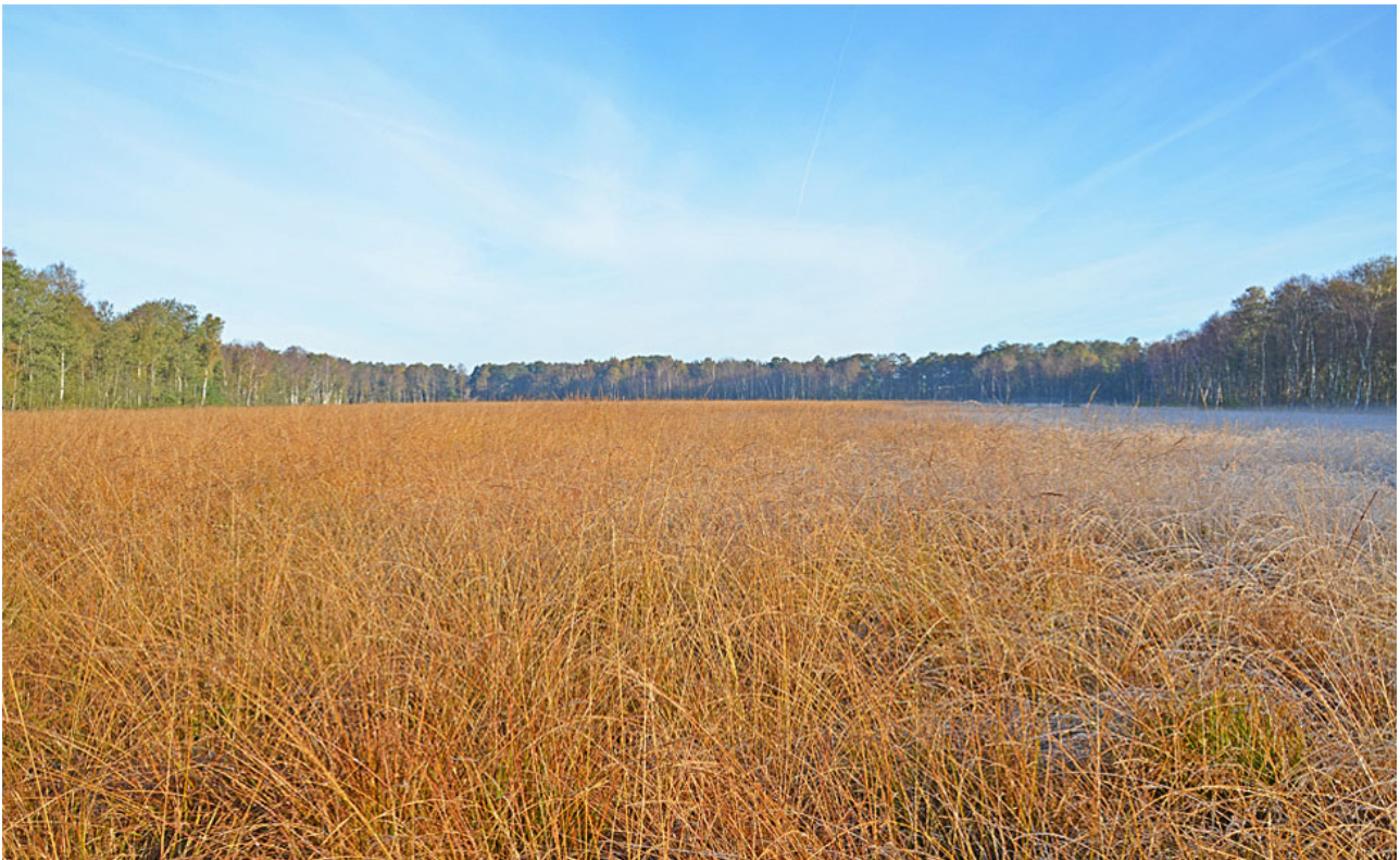
Højmosen Nybo Mose er under tilgroning med blåtop grundet uhensigtsmæssig hydrologi.

Indsatserne har dog kun omfattet mindre dele af de arealer der tidligere har været drænet. Der er derfor et fortsat behov for at genskabe mere optimal hydrologi i området.